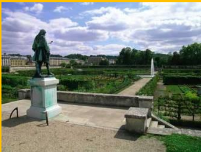
Le Potager du Roi à Versailles