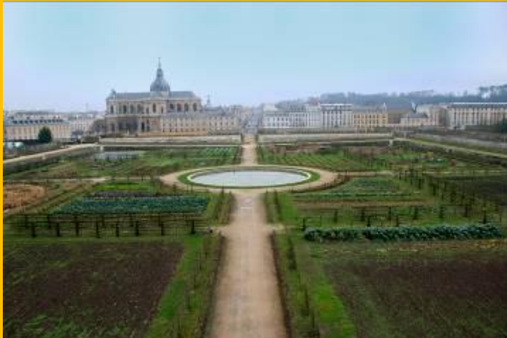
Le Potager du Roi à Versailles

Comme chaque année c'est au Potager du Roi de Versailles, dans le cadre du Mois Molière que ce spectacle verra le jour, en juin 2011.