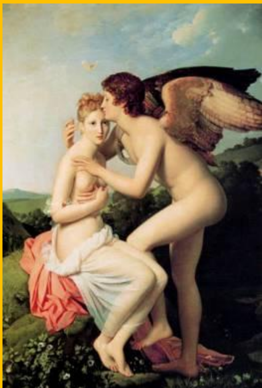
Psyché et Cupidon