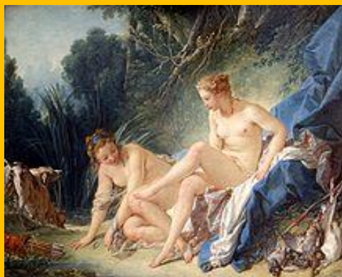
Diane sortant du bain